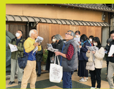
← たくさんの方が楽しまれた感謝祭