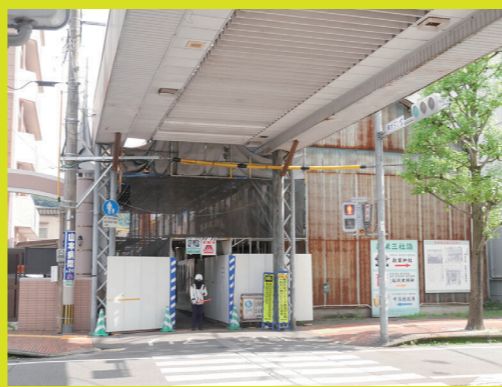
← アーケード撤去の様子 →