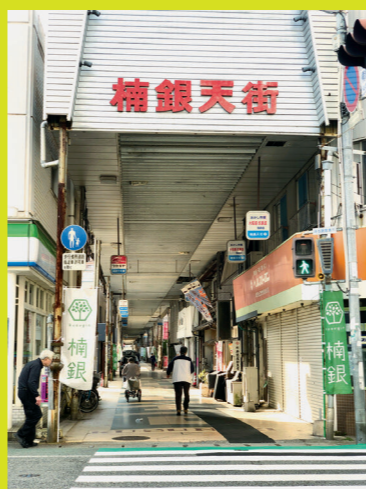
← 入口付近はまだ残されています

今後も、地元の皆様にご協力をいただきながら、新たなまちづくりに取り組んでいきたいと考えています。楠銀天街でやってみたいことなど皆さんからのご意見お待ちしております！